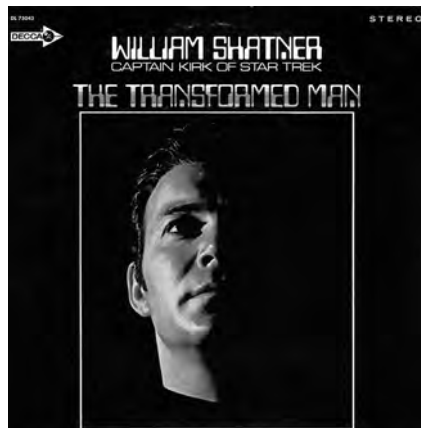
William Shatner: THE TRANSFORMED MAN , LP-Cover

Bereits als Sechsjähriger hatte sich Shatner dem Theater verschrieben. Mit acht gab er den Tom Sawyer am Kindertheater von Montreal, und seitdem verging kaum ein Jahr, in welchem der Adoleszente nicht